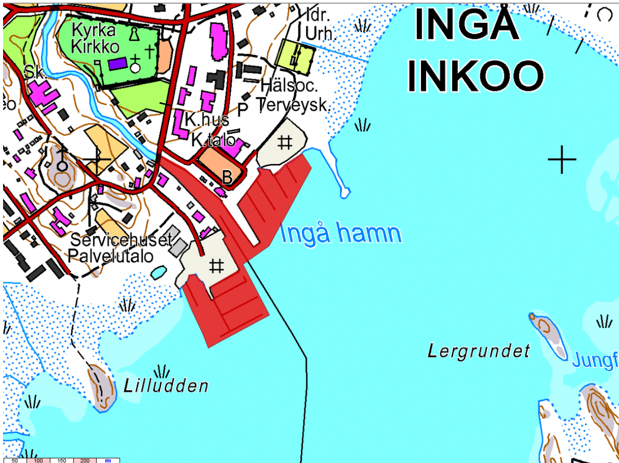
Figur 2 Karta över fiskeförbudsområdet i Ingå småbåtshamn 1.5–31.10